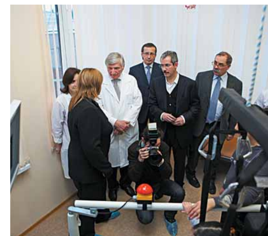
Тренажер действует. Сотрудничество будет продолжено

— Скорее всего, ближе к лету. Все-таки часто бываю в Петербурге, здесь живут мои близкие и друзья, правда, вырваться удастся лишь на выходные. И наверняка посещение института не будет визитом вежливости. Мы уже обсуждали с его директором потребности медицинского учреждения, но прежде всего надо оплатить второй транш по тренажеру. Останавливаться на полпути нельзя.