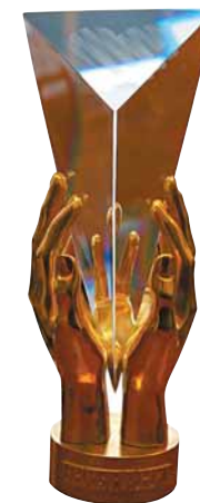
Алексей Баиндурашвили удостоен специальной премии «Первого канала», которая вручается лучшим врачам России. – «Призвание»

Профессор Баиндурашвили – максималист. Он считает, что в институте должно быть ДВА таких комплекса. Если шагать, то в ногу со временем. На недавнем симпозиуме в Швейцарии, организованном фирмой Носома, зарубежные коллеги рассказывали: оптимальный курс лечения на этих тренажерах составляет от двух до шести недель, а для обратной связи применяются приставки нового поколения с набором видеофильмов-симуляторов, главным героем которых становится юный пациент. Значит, и у нас должно быть так. Да – дорого, да – кризис, но принцип «Лучшее – детям», кажется, никто не отменял.